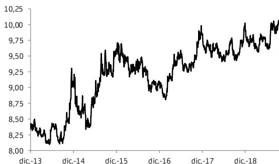
GRAFICO EURO/CORONA NORUEGA LARGO PLAZO